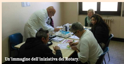
Un'immagine dell'iniziativa del Rotary.

la glicemia. Ad ogni persona intervenuta che si è sottoposta a questa visita, è stato proposto un breve test al termine del quale sono stati forniti alcuni piccoli suggerimenti per vivere meglio e in salute. I binaschini hanno risposto in modo positivo a questa iniziativa, apprezzando i progetti proposti dal Rotary Club Binasco in ambito sanitario.