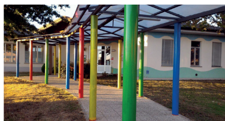
• Sopra, il progetto della nuova mensa attualmente in costruzione; a sinistra l'adiacente Scuola d'Infanzia, che sarà collegata in futuro alla stessa mensa.