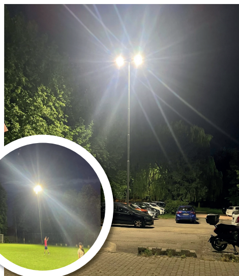
• I punti luce dei campi sportivi e quelli della tensostruttura di Vellezzo: ora sono LED.

Nel corso del 2025, si sono svolti alcuni lavori di efficientamento energetico che hanno interessato diverse strutture comunali sul territorio: sostituzione dei lampioni stradali (il lavoro è ancora in corso: nel 2026 inizieranno i lavori di scavo e sistemazione delle linee e installazione di nuovi quadri elettrici); il "relamping" degli impianti sportivi di Vellezzo e Giovenzano, ovvero la sostituzione integrale delle lampade tradizionali a incandescenza e alogene con moderne lampade a LED, della Biblioteca comunale e dell'ambulatorio me-