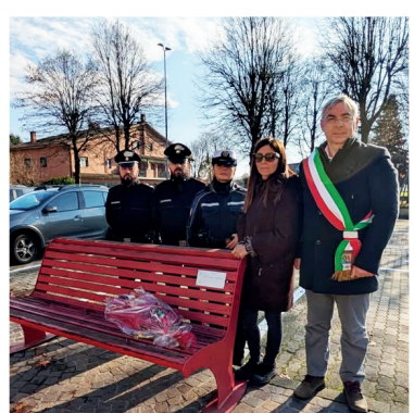
• Le due panchine di Vellezzo Bellini e Giovencano.

Sensibilizzare su un fenomeno purtroppo sempre presente è un dovere per tutti