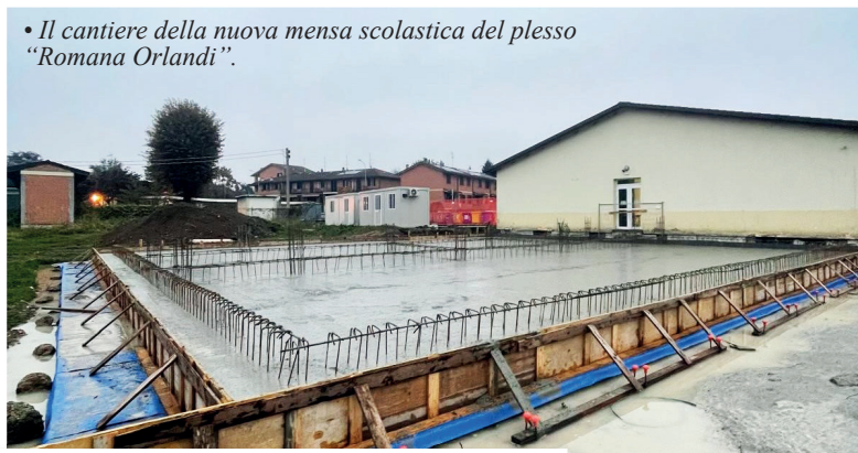
• Il cantiere della nuova mensa scolastica del plesso "Romana Orlandi".

«L'AMMINISTRAZIONE comunale desidera fare chiarezza in merito ad alcune informazioni errate apparse sulla stampa locale ri-