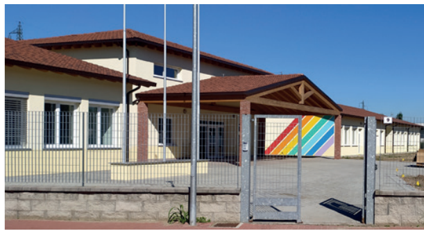
• L'edificio scolastico di Giovenzano è stato inaugurato il 5 settembre del 2020, in piena pandemia da Covid.

guardo la capienza della nuova mensa scolastica», precisa il