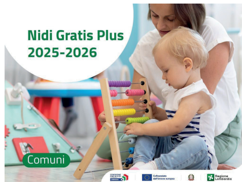
Nidi Gratis Plus 2025-2026

di fruizione della misura regionale: tel. 0382.926014, interno 2, e-mail: servizi-sociali@comune.vellezzobellini.pv.it .