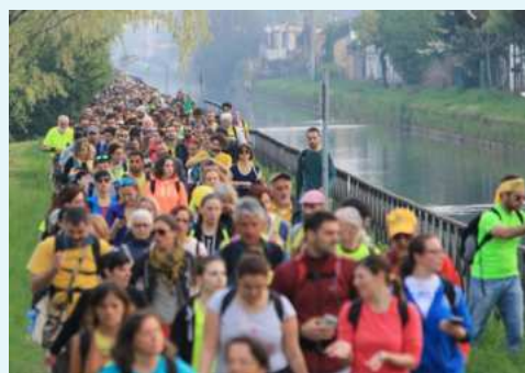
• Una foto della "Camminata Milano-Pavia" edizione 2019, alla quale hanno partecipato oltre 8000 persone.

IL COMUNE di Giussago fa parte degli Enti Patrocinanti l'iniziativa, assieme agli altri Comuni del percorso, compresa Milano, la Provincia di Pavia, Regione Lombardia e il Consiglio d'Europa.