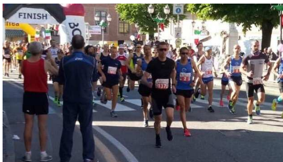
• La Mezza Maratona dei Tre Comuni in una foto della precedente edizione (2019).

Carpanela alla Barona, il Torneo Primavera Bianco-Azzurra del Giussago Calcio , la Seconda Edizione della Mezza Maratona dei Tre Comuni , la Prima Edizione di "Corri Sotto le Stelle" con Make A Wish Italia, gli eventi in programmazione a corollario degli Europei di calcio , i saggi finali della Scuola di Musica e di quella di Danza , la Bicicletta lungo