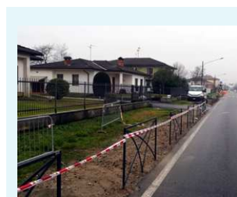
• La messa in sicurezza degli accessi a Villanova de' Beretti.

DURANTE LA SCORSA estate, l'avvio dell'indagine aveva sollevato non poche polemiche e strumentalizzazioni circa i possibili risultati che Continua a pagina 2