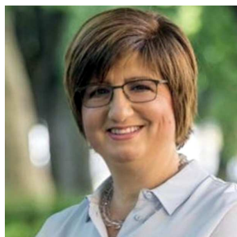
DANIELA DI COSMO SINDACO DI GIUSSAGO

AMMINISTRAZIONE. Il Sindaco scrive ai cittadini dopo l'emergenza sanitaria del coronavirus