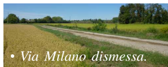
• Via Milano dismessa.

Lo sviluppo del territorio e una maggiore fruizione dello stesso sono temi che rimangono centrali per l'Amministrazione Comunale, impegnata ad implementare una rete di infrastrutture per la mobilità dolce.