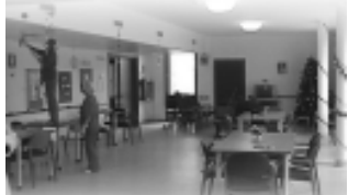
Alla KCS si addeba per le feste di Natale il salone da pranzo.

QUESTA BELLISSIMA ESPERIENZA, iniziata nel 2009 ed inizialmente dedicata solo a far trascorrere qualche ora in nostra compagnia agli anziani ospiti, da un anno si è allargata dando un aiuto