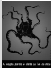
A meglio parata di città su "un ex sito"