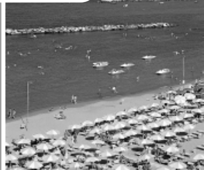
Una bella veduta di Igea Marina, sulla riviera adriatica.

GLI OPERATORI e i ragazzi si conoscono da tempo grazie agli incontri settimanali del progetto "Andare Oltre" e quindi anche questa nuova vacanza sarà caratterizzata da un clima di serenità e fiducia dei partecipanti nei confronti degli educatori e viceversa. «La vacanza è resa