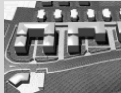
Nell'immagine qui sopra, un dettaglio del Piano "Mecatronic" di via Pionnio.

Situato al margine sud di Casorate, comprende una piccola area di 4850 metri quadrati, porzione del piano cascina Doria in corso di realizzazione. Il piano vedrà la costruzione di tre ville bifamiliari su due piani, tre ville singole di due piani più appartamenti in villa. Verranno realizzate una strada, area verde, marciapiedi e di un parcheggio pubblico ai margini del lotto.