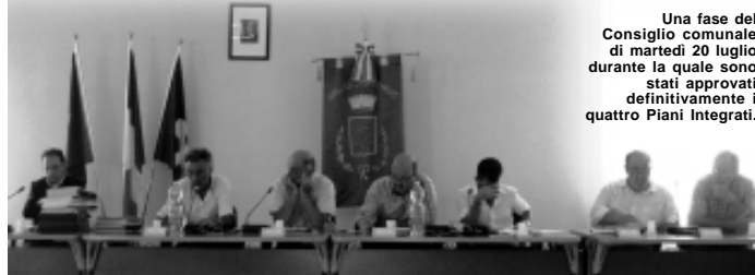
Una fase del Consiglio comunale di martedì 20 luglio durante la quale sono stati approvati definitivamente i quattro Piani Integrati.

I QUATTRO interventi rientrano nel Piano d'Inquadramento del Territorio approvato nel 2005 dal consiglio e sono il risultato della contrattazione portata avanti dall'Amministrazione comunale con gli operatori al fine di ottenere le migliori condizioni e il miglior vantaggio economico per la collettività: ogni piano prevede che vengano realizzate non solo le strade di accesso ma anche quelle esterne ai comparti, che vengano sistemate le strade limitrofe, con ampliamenti delle sedi strada-