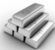
Lingotti d'oro massiccio, bene rifugio molto ambito dai super ricchi.

E COSÌ, in un decennio le disuguaglianze si sono accresciute di oltre cinque punti. La ricchezza è saldamente nelle mani di pochi e lì ci rimane, impedendo la mobilità sociale, condizionando le carriere, costruendo pezzo per pezzo una parte della nostra gerontocrazia. Secondo l'ultimo dato della Banca d'Italia