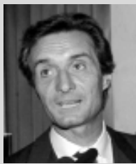
Attilio Fontana (Lega Nord).

Fontana: «Se non vengono garantite le risorse necessarie a compensare l'ICI sulla prima casa e se non modificano sia le regole del patto di stabilità sia l'importo che i comuni devono dare alla finanza pubblica è impossibile garantire i servizi essenziali e fare investimenti»