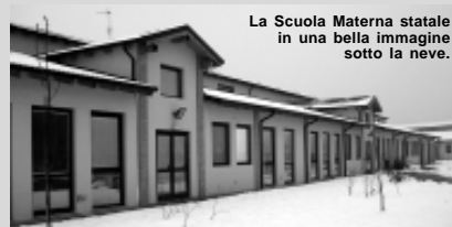
La Scuola Materna statale in una bella immagine sotto la neve.