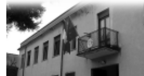
La Scuola Media "A. Scotti".

CHE SI FA , allora? Si fa che ciascuno isoli chiaramente il problema e ne faccia partecipi gli altri limpidamente, visto