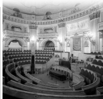
Nell'immagine in alto, la storica sede del primo parlamento italiano che fu insediato nella città di Torino, prima capitale; a sinistra lo stemma (poco noto) del Regno Lombardo Veneto.

renza governativa nell'Amministrazione Comunale"). E' evidente che il mutamento intervenuto: il Convocato nominato è sostituito dal Consiglio elettivo e la base censitaria del-