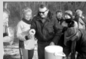
"Tapasciata" del 6 gennaio.

buon umore dei tapascioni, bencontenti di riprendere a trottare dopo le abbuffate di fine anno. Come sempre molto apprezzato è stato il generoso ristoro del dopo corsa a casa Rognoni e la gentilezza verso tutti.