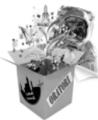
Qui sopra il logo della "Festa della Famiglia Supersonica" di domenica 31 gennaio prossimo.

Domenica 31 gennaio 2010 , a Casorate Primo, si svolgerà la "Festa della Famiglia Supersonica": la giornata inizierà alle ore 10,30 con la S. Messa nella Chiesa Parrocchiale animata dal Gruppo Girotondo con le Giovani Famiglie e degli Adolescenti della Comunità Pastorale Giovanile. Sul sagrato "Teletrasporto di S. Cristoforo" e consegna dei PASS dai nostri PR, animazioni in piazza Contardi!