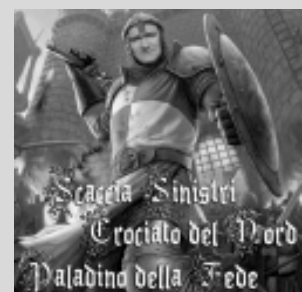
Due immagini dei bizzarri calendari di Prosperini e a sinistra il suo celebre motto per mandare "fuori dalle balles" i clandestini.

PROBABILMENTE contava anche di portarsi avanti per le elezioni regionali che si terranno fra poco, rastrellando voti che sono sempre meglio degli applausi. Invece si trova in isolamento nel carcere di Voghera dal 16 dicembre ma, come riporta il quotidiano "La Stampa", ha detto che «Se mi scarcerano mi candiderò di nuovo». Così l'autodefinitosi "Baluardo della Cristianità" e "Flagello dei Centri Sociali" conta di tornare in pista in quota Pdl che, invece, gli ha costruito intorno un cordone sanitario fatto di silenzio per non guastare la campagna elettorale ed anche perché «le sue 18.000 preferenze fanno gola a molti, nel Pdl».