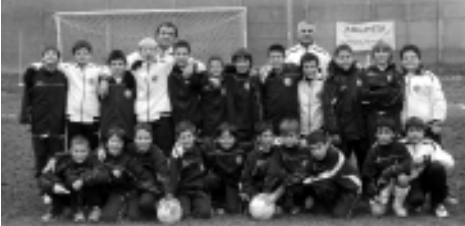
I Pulcini 1999.

ti di tempo libero. Merito di ciò è anche il rapporto di affiatamento instauratosi anche tra i genitori».