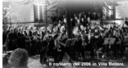
Il concerto del 2006 in Villa Belloni.

Il programma prevede l'esecuzione dei seguenti brani: - Rossini, "La gazza ladra", Sinfonia; - Bellini, "Norma", Sinfonia; - Verdi, "La Traviata: Di Provenza il mar, il suol"; - Verdi, "Rigoletto: Questa o quella"; - Puccini, "Tosca: Vissi d'arte"; - Verdi, "Aida: Se quel guerrier io fossi!...Celeste Aida";