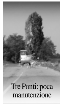
Tre Ponti: poca manutenzione