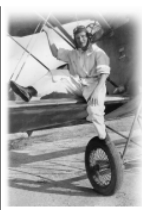
SOTTO IL CIELO DI VARSAVIA di Pasquale Caputo

Una passeggiata ecologica verso sera Ero solo nel grande parco camminavo Afflitto nei miei pensieri le mani in tasca Un moietto fischiettavo una sigaretta mi fumavo In alto guardavo le stelle contavo Aria pura respiravo lungo il lago mi aggiravo