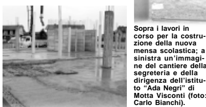
Sopra i lavori in corso per la costruzione della nuova mensa scolastica; a sinistra un'immagine del cantiere della segreteria e della dirigenza dell'Istituto "Ada Negri" di Motta Visconti.

zione - è stato previsto l'acquisto ex novo di tutte le suppellettili e gli arredi necessari, per quanto riguarda le elementari si dovrà procedere al trasloco di banchi, scrivanie e armadi attualmente utilizzati dai ragazzi e dai docenti, in modo da poter iniziare a fruire del nuovo edificio scolastico sgombrando al contempo la vecchia sede. Sarà proprio sullo stabile di piazza San Rocco che si concentrerà in seguito l'attenzione dell'impresa impegnata nella costruzione del plesso scolastico, intenzionata ad abbattere il vecchio