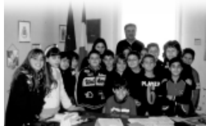
Foto ricordo per le classi di quinta elementare che insieme alle loro insegnanti si sono recate in visita agli

Uffici Comunali e incontrato il Sindaco Gian Antonio Rho; la visita aveva lo scopo di approfondire gli argomenti studiati in