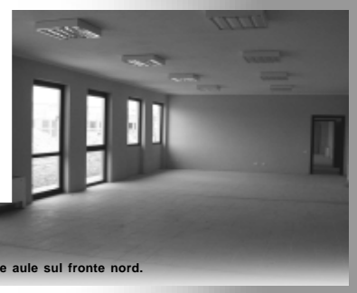
Le aule sul fronte nord.