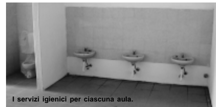
I servizi igienici per ciascuna aula.

Ecco le prime immagini della Scuola per l'Infanzia Statale del plesso scolastico di via Carlo Porta: a sinistra l'ampio corridoio coi tetti in legno e le travi a vista sul quale convergono le aule della scuola, tutte situate al piano terra (come previsto dalle leggi vigenti) e ciascuna dotata di servizi igienici autonomi con accesso ai giardini. La struttura verrà separata dal resto del cantiere con un'apposita recinzione.