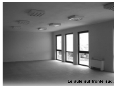
Le aule sul fronte sud.