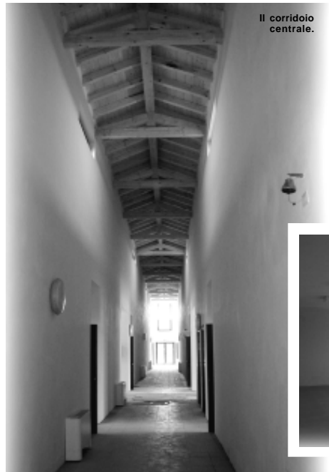
Il corridoio centrale.

Il fabbricato è stato realizzato in modo tale che, all'occorrenza, possa alzarsi di un piano