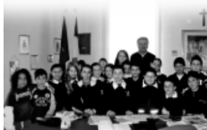
FOTO RICORDO PER LE CLASSI DI QUINTA ELEMENTARE

Per quanto riguarda invece la disdetta da parte del conduttore, occorre tenere presente che quest'ultimo, qualora ricorrano gravi motivi, può recedere in qualsiasi momento dal contratto, dandone comunicazione al locatore con preavviso di sei mesi.