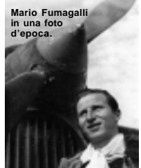
Mario Fumagalli in una foto d'epoca.

volo, tra azioni belliche, medaglie al valor militare, voli acrobatici, incontri alla Casa Bianca... appuntamento quindi al prossimo numero!