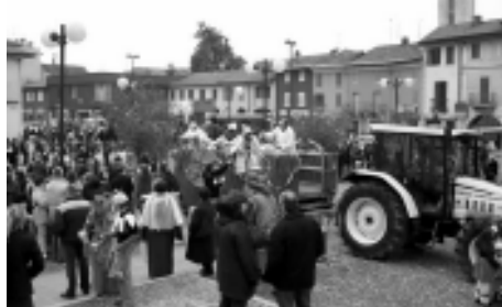
Il corteo di Carnevale in una foto dell'anno scorso.

un diavolello che fa il mangiafuoco al centro della piazza. Ma chi sarà? Beh, l'abbiamo riconosciuto tutti or-