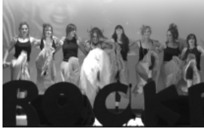
Un'immagine della sesta edizione della manifestazione.

D opo l'esibizione del gruppo casoratino, l'Associazione "PAVIA Fotografia" propone la proiezione di alcuni tra i migliori scatti dei suoi soci, accompagnati da una musica di sottofondo, seguiti dalla seconda esibizione della FIT Factory, che presenta un mix di coreografie coinvolgenti e ammantati molto gradite dal pubblico. È il turno dei D.E.C.A., che trasmettono