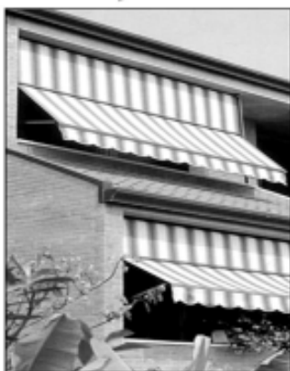
TENDA A CADUTA

Tutti i nostri prodotti sono costruiti nel rispetto della normativa UNI ISO 9001 ed espongono il marchio CE