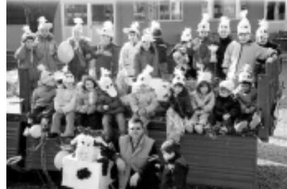
Una bella immagine di Carnevale coi bambini della Materna.

L a Scuola ora è ricca di stimoli e suggestioni per insegnare al bambino a vivere in modo attento e coscienzioso la piazza della sua città e scoprire che essere un buon cittadino è qualcosa di divertente e affascinante. Non siete curiosi di sapere come andrà avanti la storia della città dei vostri bambini? Ebbene per conoscere la città del futuro che immaginano i bambini di Motta, vi aspettiamo alla festa finale, tutti sarete invitati a scoprire come il potenziale che è dentro queste piccole creature se viene ben indirizzato può regalare emozioni straordinarie. A presto!