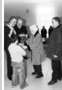
Il Sindaco Rho e l'Assessore Artemagni premiano una gentilissima anziana "supernonna".

Nelle pagine successive dedichiamo un reportage alla situazione degli anziani casoratesi e dei servizi comunali erogati loro quotidianamente