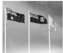
Lingue del Mondo: per sentirsi a proprio agio nel mondo, viaggiando per lavoro o per piacere...