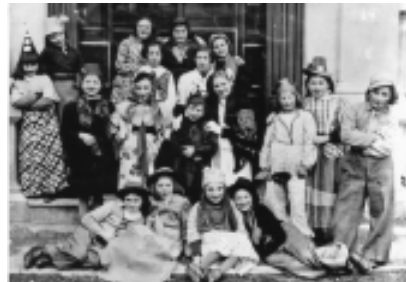
Sopra, le ragazze casoratesi dell'anno scolastico 1948-49 in questa bellissima foto molto "vintage".