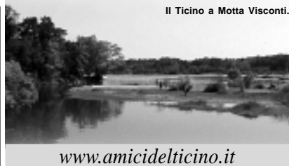
Il Ticino a Motta Visconti.

di Roberto Vellata Associazione "Amici del Ticino"