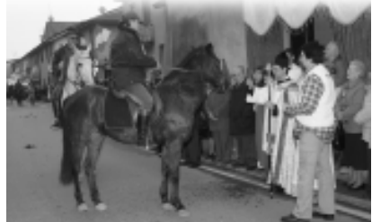
In basso a sinistra la benedizione impartita da Don Giorgio proprio davanti alla Chiesa di Sant'Antonio, molto amata dai casoratei; A destra l'arrivo dei Vigili del Fuoco e più a destra ancora il falò acceso.

P erseverando nell'iniziativa, la Contrada Sant'Antonio mantiene viva la tradizione di queste feste popolari che traggono origine da tempi passati: con questa Festa, ogni anno si rinnova il ricordo di vicende ormai molto lontane ma che fanno comunemente parte della "storia" di Casorate e quindi di tutti noi.