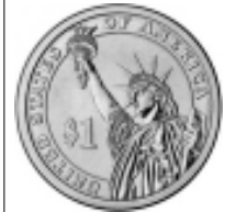
Ecco il dollaro di metallo (tratto da Repubblica.it).