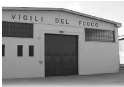
stiamo mettendo a punto strategie di controllo del territorio; entro giugno verrà inaugurata la sede dei Vigili del Fuoco; l'autovelox funziona come deterrente alla

« M a, come avevamo promesso, le telecamere sono solo un tassello di un più ampio programma sulla sicurezza dei cittadini, che stiamo portando avanti», continua Rho: «abbiamo aperto un bando per potenziare l'organico di Polizia Locale; con la Protezione Civile