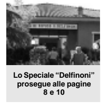
Lo Speciale "Delfinoni" prosegue alle pagine 8 e 10

N on si è trattato di una fase semplice da gestire perché accanto alla sistemazione del progresso, la casa di riposo si è trovata impegnata in questo biennio ad affrontare nuovi investimenti e di cui all'inizio del mandato non si aveva completa percezione;