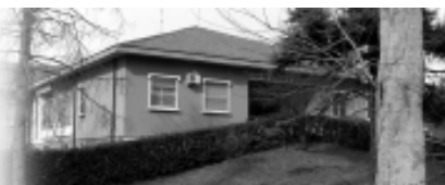
Nell'immagine in basso, la Casa di Riposo "Delfinoni" (immagine tratta dal sito www.pagineinrete.it ).

è di 4 ore al giorno: sarebbero 5 ore al giorno diminuite di 1 ora per l'inizio anticipato del turno notturno. RISPARMIO DI 4 ORE GIORNALIERE x euro 15,04/ora: euro 60,16/giorno, annuo: euro 21.958,40. SERVIZIO LAVANDERIA: situazione precedente: n. 3 operatori per un totale di 15 ore al giorno. Situazione attuale: n. 2 operatori per un totale