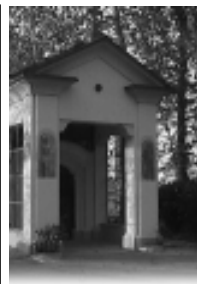
Nell'immagine sopra, il Lazzaretto, uno dei punti videosorvegliati dalle telecamere e a sinistra la sede dei Vigili del Fuoco, che verrà presto inaugurata.

velocità nelle vie del paese e tanti cittadini ci hanno manifestato il loro apprezzamento».