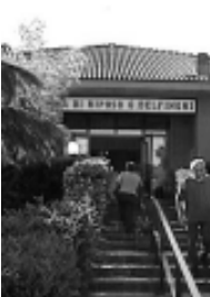
L'ingresso della Casa di Riposo di Casorate Primo "Gottardo Delfinoni".

CASORATE PRIMO - Nel corso del tradizionale Consiglio d'Amministrazione aperto alla cittadinanza, svoltosi lo scorso 5 maggio presso la sala consiliare del Municipio, le relazioni presentate hanno evidenziato come la Casa di Riposo sia attualmente in una posizione di tranquillità economica e, grazie al riassetto di molti settori, a una politica di tutela della qualità dell'assistenza, a un'attenta politica di risparmio, ad una corretta gestione del personale, possa veramente porsi in competizione con analoghe strutture presenti nel territorio.