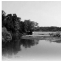
Un centro estivo dove la natura e il Parco Ticino sono protagonisti.

Le attività che avranno luogo nel Parco del Ticino sono le seguenti: canoa canadese, canoa Sit on Top, escursioni naturalistiche, discesa soft-Rafting, ricerca dell'oro, edu-