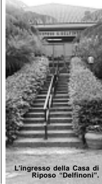
L'ingresso della Casa di Riposo "Delfinoni".