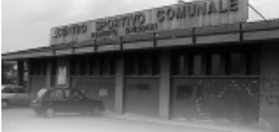
Il Centro Sportivo "Chiodini".

no fatto una goleada, per loro questa fase finale di campionato sarà sicuramente molto esaltante.