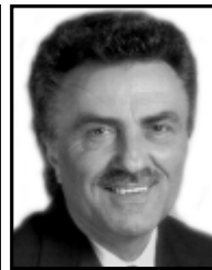
Il Sindaco Rho.

Il Sindaco poi parla dell'osservatorio civico, già attivo da mesi e strumento utilissimo per il monitoraggio del territorio. Un territorio per il quale occorre un progetto di inquadramento e