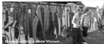
Murali artistici a Motta Visconti.

nacciosi nei confronti di loro coetanei, di adulti, di cose pubbliche perché hanno problemi in famiglia, oppure perché hanno bisogno di sfogare i loro malesseri imitando situazioni di ricatto e di violenza proprie del mondo delinquenziale adulto. Bisogna conoscere e indagare sulle storie personali: di solito infatti questi ragazzi sono pieni di disprezzo nei confronti dell'autorità, non hanno fiducia nelle regole e nelle leggi, perché non le vedono rispettate dai loro genitori e dagli adulti che li circondano.