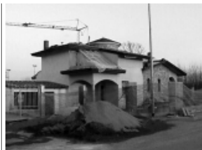
In alto, una delle abitazioni che stanno sorgendo lungo viale De Gasperi, nella lottizzazione che si affaccia sul futuro Ecocentro.